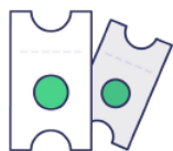
BILLETTERIE EN LIGNE

Des outils de gestion et de paiement créés pour les clubs et les associations :