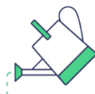
FORMULAIRE DE DON