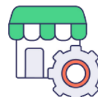
BOUTIQUE EN LIGNE